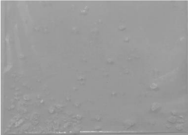
Slika 2: Beli kristali borove kisline, ki so se prodajali kot kokain

Beli kristali, ki so se prodajali kot kokain, pa so vsebovali borovo kislino, ki se uporablja kot antiseptik, insekticid in kot zaviralec gorenja.