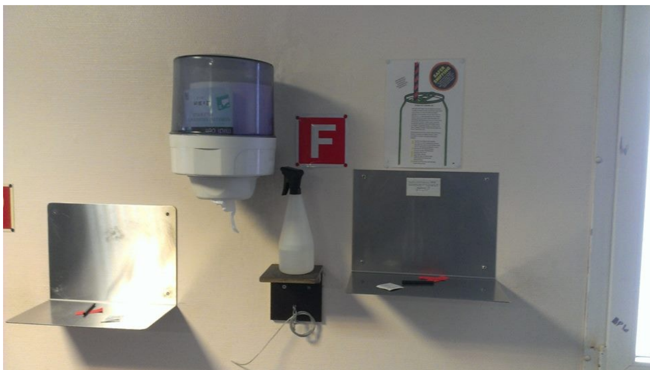
Slika 1: Prostor za injiciranje drog

V varni sobi za injiciranje drog lahko naenkrat droge injicira 10 oseb. Prepovedana je preprodaja drog, nasilje, rasistične in seksistične izjave . Uporabniki lahko uporabljajo vse nelegalne droge, edina omejitev je kombinacija z alkoholom. Če za nekoga sumijo, da je pod vplivom alkohola, ga zavrnejo, da pride kasneje. Po uporabi je uporabnik dolžan pospraviti za sabo in prostor injiciranja dezinficirati. Po injiciranju mora glavni prostor zapustiti, saj ponavadi že čakajo naslednji. Ko sem poslušal predstavnika organizacije, se mi je zdelo, da delujejo po principu tekočega traku, saj je prostor res premajhen za problematiko, ki jo ima Basel.