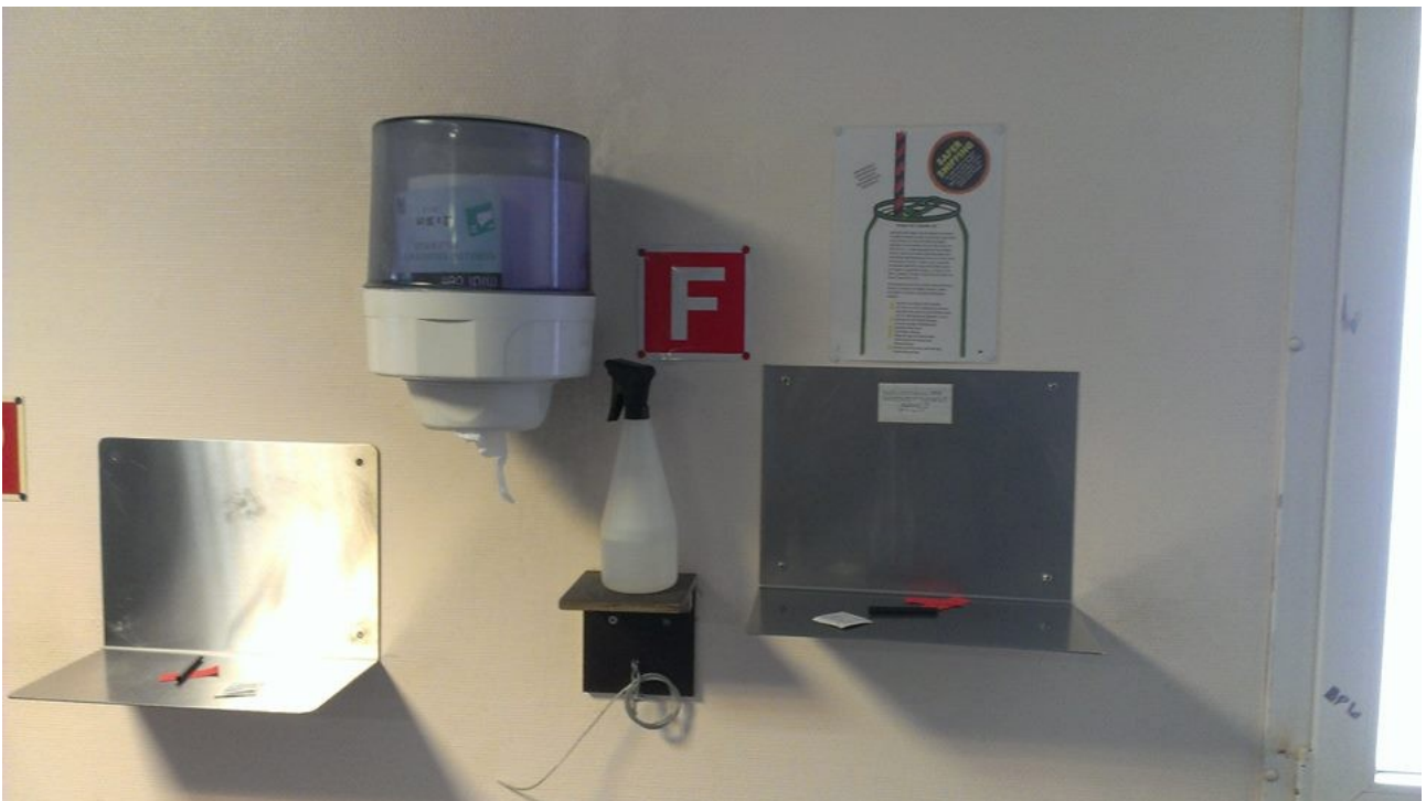
Slika 3: Prostorček za snifanje.

Zelo zanimiva pa se mi je zdela ideja prostorčkov za snifanje drog , ki so razporejeni po vseh stenah v dnevnem centru - in sicer v različnih višinah - primerno za vsakogar. No, tudi tukaj je odgovornost vsakega uporabnika, da za seboj prostor pospravi in počisti.